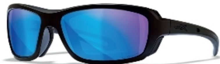
WILEY X «WAVE»