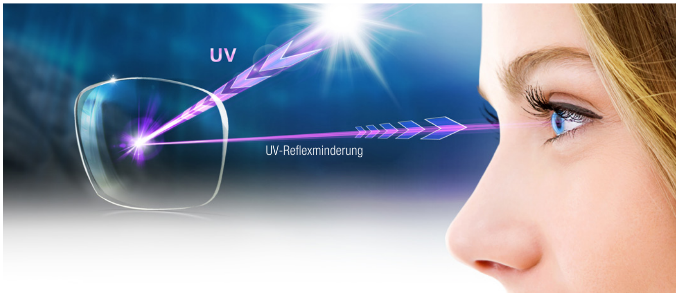
Reflexion auf der Rückfläche des Brillenglases mit Optiplas Dual+ UV